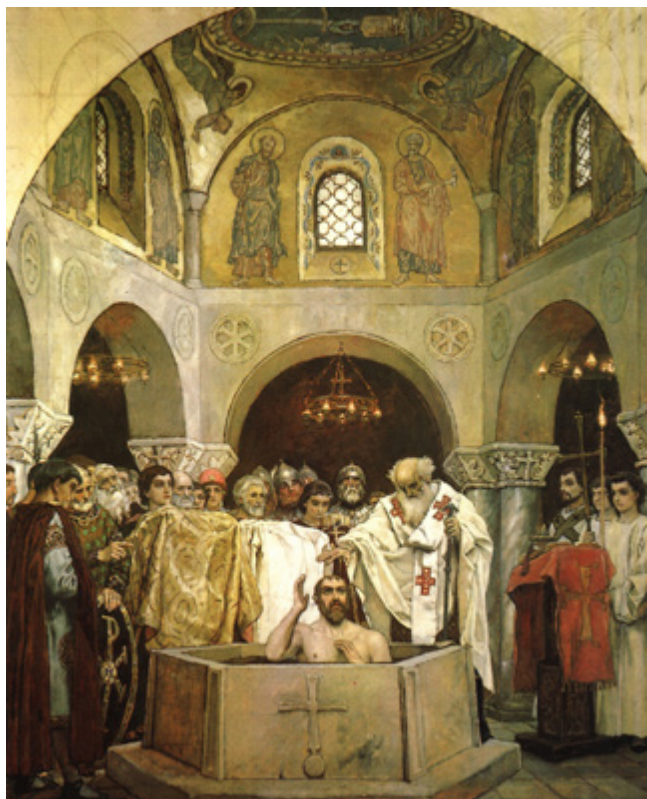
Pokrštavanje kneza Volodymyra 988.

prostora do Volge. Konsolidirajućim središtem bio je Kijev, s narodom koji je prema iskonskom nazivu Rus' imenovan Rusyni, Rusyči, od kojih je nastao suvremeni ukrajinski narod. Zemlja se širila zahvaljujući ratnim tradicijama, u sudaru s osvajačima koji su neprekidno dolazili na ukrajinske ravnice. Šireći svoju vladavinu, staroukrajinska država Rus' neizbježno se sudarala s krimskim problemom. Arheološka svjedočenja upućuju na slavenske tragove na tom prostoru još iz praslavenskoga razdoblja, ali dinamika proširenja na Krim izražena je od 9. stoljeća, kada postaju sve češći sudari kijevskih kneževa s krimskim etnijama, vojnim formacijama. Prvi su kijevski kneževi Askoljd, Oleg, Igor, Svjatoslav, Volodymyr ratnim pohodima dobili i proširili pristup Crnomu moru, na kojem su vršili vojnu ekspanziju.