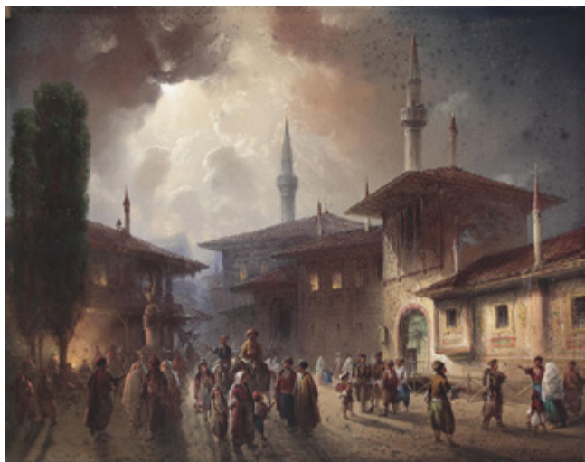
Carlo Bossoli, Pogled na Khanovu palaču, Bahčisaraj, 1857.

krimskotatarske etnije uz znatan udio Polovaca. Stanovništvo Krimskoga kanata bavilo se agrarnom proizvodnjom, stočarstvom, u stepskoj zoni još se čuvao nomadski način života. Gospodarstvo se razvijalo zahvaljujući proizvodnji soli, po kojoj je Krim bio poznat na istočnoeuropskom prostoru.