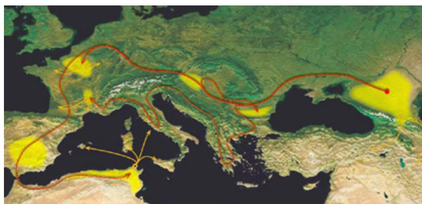
Prolazak Alana kroz hrvatski prostor