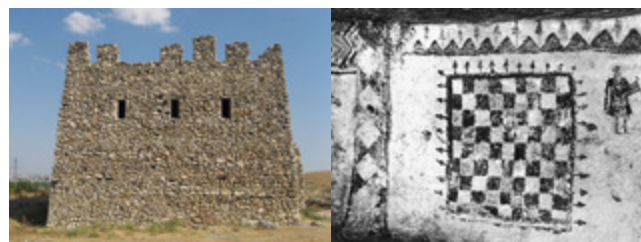
Neapolj Skitski, zidno slikarstvo

tradiciji ratobornih jahača-nomada koji su okupljali mnogobrojna plemena pod jednim nazivom, kako se to često događalo na azijskim prostorima, i vodili ih na osvajanje novih teritorija, gdje je ukrajinska crnica bila tradicionalni zavičaj poznat po pogodnim uvjetima za stočarstvo. U polietničkoj skupini Sarmata spominju se plemenski nazivi kao Jazigi, Roksolani, Aorsi, Siraki, Alani. Potonji su posebice zanimljivi po dinamici migracija, naravno ratnih, koje dosežu sve do Španjolske, a poznavali su i jadranski pravac. 2 Prema suvremenom ukrajinskom jezikoslovcu Kostiantynu Tyščenkou prolazak Alana kroz hrvatski prostor odrazio se u nizu toponima, među ostalim i u nazivu planine Alan. 3 Među tragovima Sarmata na Krimu znanstvenike su privukli takozvani sarmatski znakovi. U trajnoj diskusiji o njihovu nastanku i funkciji posebice je zanimljiva pretpostavka ukrajinskih istraživača o mogućnosti povezanosti nastanka glagoljice s tim znakovima, za koju bi mogli biti korišteni određeni modeli u izgradnji te grafije. 4